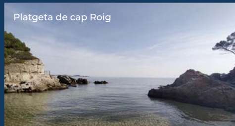
Platgeta de cap Roig