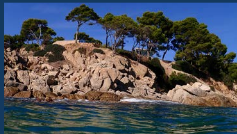
Cap de Penyes Blanques