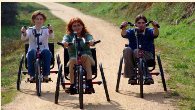
Vía Verde El Carrilet