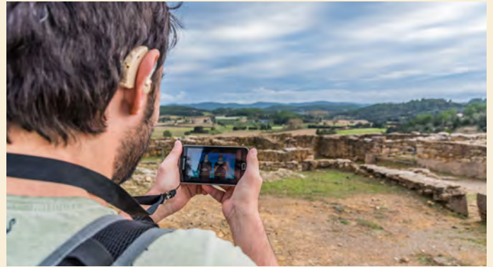
Museo de Arqueología de Catalunya - Ullastret (@INMEDIA)