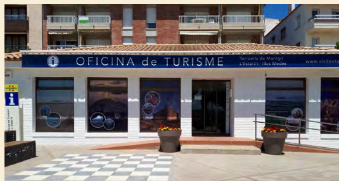
Oficina de turismo de l'Estartit