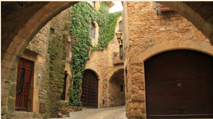
Centro histórico de Pals