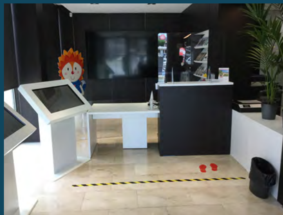
Oficina de turismo de Castell - Platja d'Aro