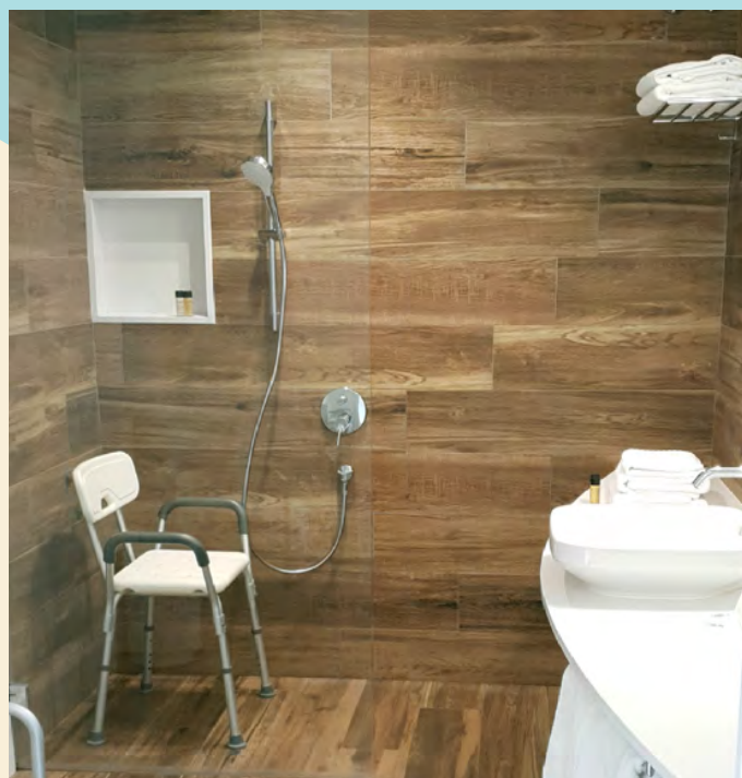
Hotel Can Miquel