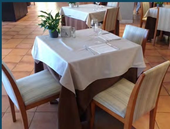
Hotel Ilunion Caleta Park

Todas las propuestas que encontraréis a continuación han sido previamente validadas por una empresa especializada en accesibilidad turística y responden a la voluntad de empresas y entidades turísticas de la comarca, públicas y privadas, de ofrecer servicios e instalaciones cada vez más adaptadas y para todos. Veréis que cada propuesta ofrece facilidades para necesidades diferentes. Los iconos os ayudaran a distinguir a quién se dirige cada propuesta.