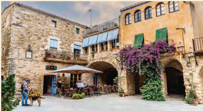
Centro histórico de Peratallada