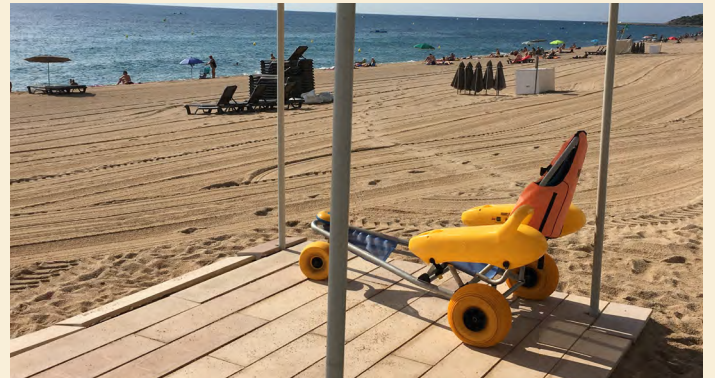
Platja Gran de Platja d'Aro